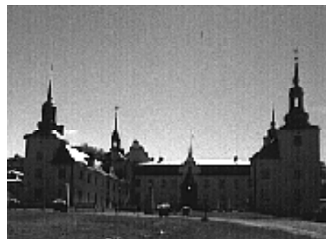
Castelul de la Tyresö, fațada spre curtea de intrare.

Deși născut suedez, Claes Lagergren nu era marchiz suedez, în Suedia neexistând titlul de marchiz. El s-a născut ca om de rând și a fost făcut cu timpul marchiz al Statului Papal și numit ambasadorul papei în Suedia. Castelul l-a cumpărat pentru el și familia sa, cât și o capelă catolică. Cu ajutorul arhitectului Isak Gustaf Clason, marchizul a reconstruit castelul în spiritul neo-romantic de la sfârșitul secolului XIX, având ca model castelul din secolul XVII.