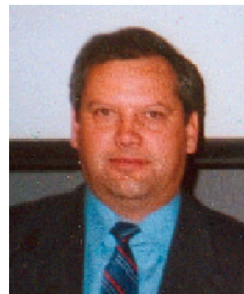
Dr. ing. Dumitru Dorin Prunariu, general de flotilă aeriană, la aniversarea a 20 de ani de la zborul său cosmic cu o durată de 7 zile, 20 de ore și 42 de minute.

"CRED CĂ CINE A AJUNS ODATĂ ÎN SPAȚIUL COSMIC O SĂ-L VISEZE TOATĂ VIAȚA."