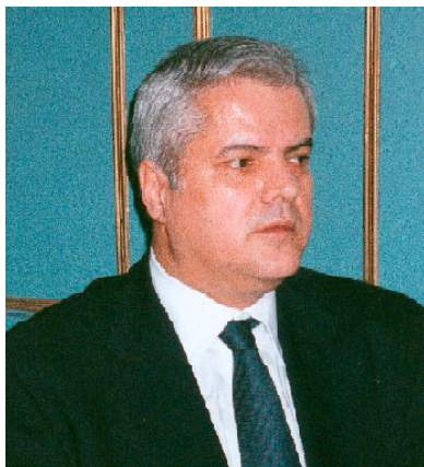
D-ul Adrian Năstase.

"ACUM CRED CĂ ESTE IMPORTANT SĂ CREĂM O SINERGIE ÎN CEEACE PRIVEȘTE ACȚIUNILE NOASTRE COMUNE."