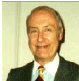
Nils G. Revelius.

Trimestrul al doilea al anului 2001 a fost și el dominat de președinția suedeză a UE. Aceasta a culminat cu vizita prim-ministrului suedez la București la 24 iunie și semnarea unui acord care a pus capăt unei dispute bilaterale de datorii pe care negocierii duse timp de peste o jumătate de secol nu au fost capabile să o rezolve.