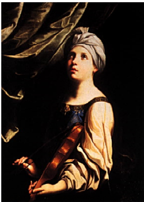
Guido Reni: Sfânta Cecilia cântând la vioară, ulei pe pânză, 99,5x74 cm, 1630-35.

Aceasta, care trăise în secolul III d.Hr. la Roma, a suferit o moarte de martir creștin împreună cu soțul său, Valerianus. Cultul Sfintei Cecilia a însemnat totodată punctul de plecare pentru trecerea Bisericii Catolice la readucerea la viață a vechilor culte creștine. Paolo Camillo Sfondrato, pe atunci cardinalul titular la Santa Cecilia în Trastevere, a inițiat imediat după descoperirea corpului sfintei un program de înfrumusețare a bisericii închinată acesteia, dând în sarcină mai multor artiști ca prin picturi și sculpturi să o glorifice pe Sfânta Cecilia și să illustreze scene din viața ei. Sculptorul Stefano Maderno a realizat atunci statuia care redă corpul Sfintei Cecilia în starea în care se afla când a fost descoperit, bine conservat, cu urmele încercării de decapitare, culcat pe o parte cu fața în jos și îmbrăcat într-o cămașă lungă de condamnat, iar pe cap cu o pânză ca de turban, desfăcută. Guido Reni, pe atunci un pictor deja foarte admirat și bine plătit, a primit în 1601 comenzi de la Sfondrato pentru picturile Martirul Sfintei Cecilia și Încoronarea Sfintei Cecilia și a lui Valerianus.