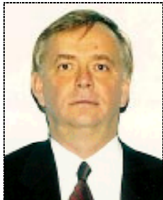
Svante Kilander. Foto: © Svante Kilander.

S.C.: Svante Kilander, ești de 2 luni noul ambasador al Suediei la București.