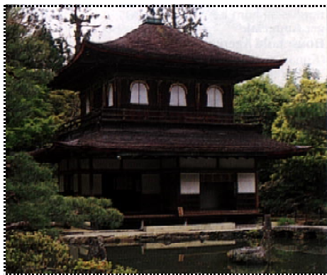
Pavilionul de Argint de la templul Ginkakuji.

În apropierea capătului de nord al Promenadei Filozofului și la răsărit de ea, la poalele muntelui Higashiyama, se află templul cunoscut sub denumirea de Ginkakuji, dar al cărui nume adevărat este Jishoiji. Este vorba despre un ansamblu arhitectural și peisagistic de o deosebită frumusețe, care este totodată și unul dintre centrele importante de cultură pentru activități ca ceremoniile ceaiului, teatrul no, ikebana (arta aranjării florilor tăiate) și pictura în tuș.