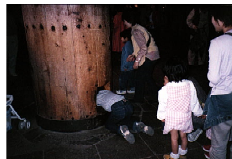
Detaliu de stâlp interior din Hala Marelui Buddha. La dreapta, lume la coadă pentru acces în Nirvana.

Todaiji a fost dat în folosință în anul 752 și a fost executat la comanda împăratului Shomyo pentru a da adăpost statuii de bronz înalte de 16 metri a lui Buddha - Vairocana, turnată în anul 752, cea mai mare statuie de bronz din lume reprezentându-l pe Buddha. Hala Marelui Buddha a fost recondiționată de mai multe ori, structura pe care o vedem astăzi fiind din anul 1709. Deși reprezintă doar două treimi din dimensiunea sa originală, ea este totuși cea mai mare construcție de lemn din lume. Structura sofisticată de acoperire compusă din console și grinzi, construită în perioada 1688-1709, este opera unor meșteri dulgheri veniți din partea de sud a Chinei. Acoperișul în două etaje, cu forma sa curbată decorată cu două "coarne" aurite, a fost realizat în secolul XVIII. Stâlpii sunt formați din elemente de lemn îmbinate cu chingi și piroane de metal. O curiozitate: într-un stâlp aflat în spatele lui Buddha este făcută o gaură și se crede că cel ce se poate strecura prin ea va ajunge în Nirvana.