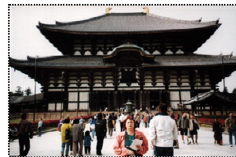
Intrarea la Hala Marelui Buddha din Todaiji.

Complexul templului Todaiji cuprinde Hala Marelui Buddha (Daibutsuden), câteva temple mai mici, hale, pagode, lanterne, fântâni și porți de mare interes istoric și arhitectural.