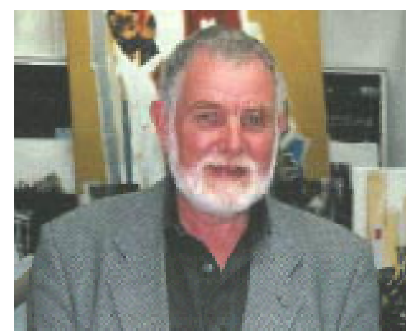
Domnul Gert Fabritius.

Silvia Constantinescu: Gert Fabritius, ești unul din artiștii plastici de renume din Germania. În 1997 ai obținut premiul Lovis-Corinth, lucrările tale sunt expuse în expoziții și aparțin unor colecționari din întreaga Germanie, de la Berlin la Stuttgart, la München, etc., dar și în USA sau Suedia. Despre arta ta s-a scris foarte mult între 1977-2002. Ca artist german, născut în România, te-am mai prezentat în CURIERUL ROMÂNESC, în urmă cu peste 17 ani. Fii bun și povestește cititorilor mei despre munca ta din ultimii ani.