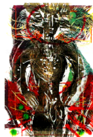
Gert Fabritius: Iason observatorul. Xilogravură și tehnică mixtă. © Gert Fabritius.

G.F.: În ultimul timp mă preocupă două simboluri importante: unul este simblul scaunului și al doilea barca, vaporul. Și scaunul, și barca, în limba germană, cred că și în română, au o semnificație deosebită. În germană există expresia "toți suntem într-o barcă!". Scaunul, pentru mine, care vin din Transilvania, are o semnificație deosebită, căci acolo regiunile au fost numite "scaune":