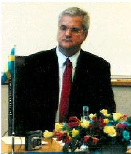
D-ul Adrian Năstase.

"NU CRED CĂ ZIARISTUL TREBUIE SĂ FIE NUMAI CÂINELE DE PAZĂ AL DEMOCRAȚIEI. EU CRED CĂ TREBUIE SĂ FIE UN PARTICIPANT LA EFORTUL GENERAL PE CARE-L FACEM PENTRU A CREA IMAGINEA ȘI REALITATEA UNEI ȚĂRI ATRĂGĂTOARE PENTRU INVESTIȚII."