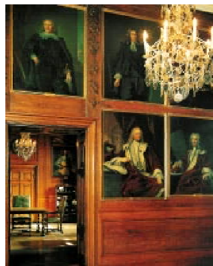
Perete în sala Mareșalului de Țară; la dreapta, portretul lui Arvid Bernhard Horn, pictat de G.E. Schröder în 1727. În fundal, camera de intrare.