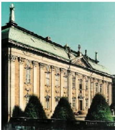
Casa Nobilimii - Riddarhuset, fațada dinspre canalul Riddarholmen.

Pe urmă, se poate spune, în ceea ce privește bursele, că avem burse culturale pe care le decernăm noi și acestea nu este nevoie deloc să fie doar pentru membrii Casei Nobilimii, ci poate fi vorba despre persoane ce au îndeplinit acțiuni culturale pe care Direcțiunea (Casei Nobilimii, n.tr.) consideră că merită să le sprijinim.