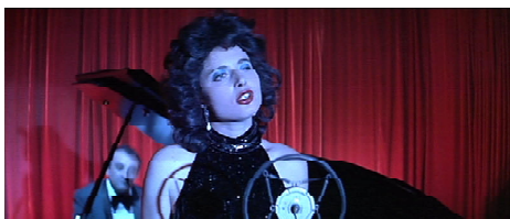
Scenă din filmul "Blue Velvet" cu Isabella Rossellini.

a avansa în ierarhiile lumii filmului. În schimb, el aparține minorității regizorilor de timp lung care vin din lumea artei plastice. La început, Lynch lucra cu pictură, dar arta aceasta statică l-a făcut să-și piardă răbdarea, el voia să facă artă care să se miște și să facă gălăgie. Unul dintre cele mai cunoscute filme ale sale este "Blue Velvet" din 1986, al cărui manuscris l-a scris el însuși, iar rezultatul a fost măiestru: intriga se derulează în jurul inocentului orașel Lumberton, care se arată a ascunde o lume obscură sub suprafața sa prietenoasă. Și aici înșală aparențele – o fascinație nesănătoasă și o atracție către întuneric ies la suprafață, personificate de Dennis Hopper și Isabella Rossellini în două realizări actoricești de neuitat. Tema din "Blue Velvet" revine apoi în diferite forme în aproape fiecare film de Lynch de după aceea, aceasta și în mult discutatul său film "Twin Peaks". La Festivalul Filmului de la Stockholm, unde sunt organizate și așa-numite "nopti cu temă" și unde, în loc să mergi acasă să dormi, poți să zaci într-un scaun de cinematograful de la imediat după miezul nopții și până în zori, s-a prezentat într-un asemenea cadru întregul serial "Twin Peaks" pentru publicul său fidel. Tot la acest Festival s-a organizat și o foarte apreciată întâlnire "Face2Face" între David Lynch, presa și public.