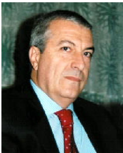
Domnul Călin Popescu-Tăriceanu.

"ASTĂZI ESTE O MARE PROBLEMĂ ÎN TOATĂ POLITICA ROMÂNEASCĂ CĂ ÎN LOC CA ÎN INTERIORUL PARTIDULUI SĂ AIBE LOC DEZBATERI DE IDEI ȘI SĂ SE FACĂ COAGULAREA OAMENILOR ÎN JURUL UNOR PROGRAME, SE PREFERĂ ÎNCĂ, ÎN MULTE FORMAȚIUNI POLITICE, REGRUPAREA DUPĂ AFINITĂȚI MAI DE GRABĂ DE ORDIN PERSONAL, CEEA CE MI SE PARE UN LUCRU NEFIRESC ȘI NEPRODUCTIV."