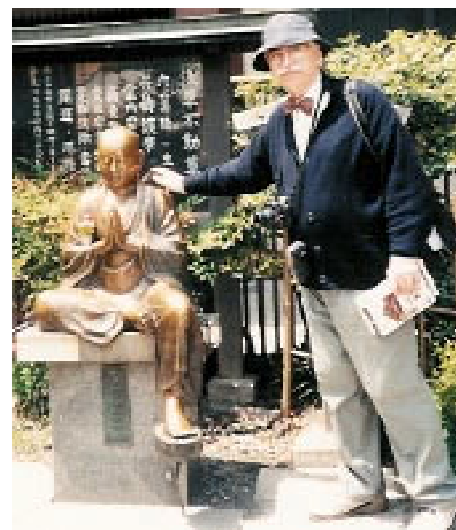
Buddha Nadi Botokesan îi vindecă, se spune, de diverse dureri corporale pe cei care îl mângâie. Soțul meu nu crede-n superstiții, dar l-a mângâiat totuși pe Buddha Nadi Botokesan. Poate, cine știe...