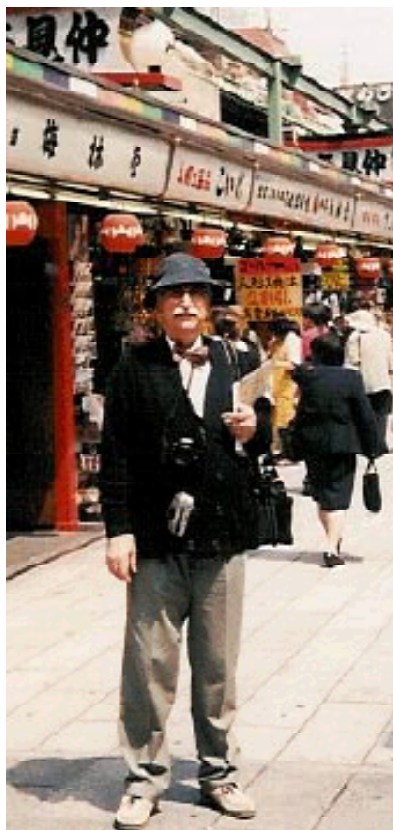
Pe strada comercială Nakamise-dori de la complexul templului Sensoji.

Ca să ajungem la templul Sensoji, obiectivul principal al vizitei noastre în această zonă, trebuia, de unde ne aflam, să intrăm prin Strada comercială Nakamise-dori, un fel de Lipșcani din București, cu toate străduțele din împrejurimi, sau Drottninggata din Stockholm. Această stradă era plină de