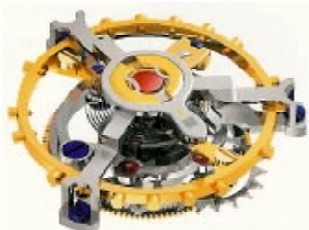
Turbionul de la IWC conține peste 100 de părți individuale și cântărește numai 0,296 gr.

* 1868 - Florentine Ariosto Jones, ceasornicar din Boston, Massachusetts fondează International Watch Company la Schaffhausen, ca să producă mașinării de calitate pentru piața americană. * Jones a construit "calibrul Jones", o mașinărie de ceas de buzunar, de calitate superioară, dotat cu o săgeată de rachetă foarte lungă, permițând un reglaj perfect al preciziei de mers. * 1874 IWC s-a transformat într-o societate anonimă pe acțiuni. * 1874-75 - se construiește clădirea actuală "casă mamă" a lui IWC, situată pe Baumgartenstrasse 15, la malul Rinului. * 1876 - noile taxe de vamă fixate de americani pentru import interzic firmei IWC accesul la piața sa cea mai importantă. Jones pleacă și Banca Comercială din Schaffhausen preia întreprinderea.