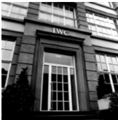
Clădirea manufacturii IWC în Schaffhausen.

* 1868 - Florentine Ariosto Jones, ceasornicar din Boston, Massachusetts fondează International Watch Company la Schaffhausen, ca să producă mașinării de calitate pentru piața americană. * Jones a construit "calibrul Jones", o mașinărie de ceas de buzunar, de calitate superioară, dotat cu o săgeată de rachetă foarte lungă, permițând un reglaj perfect al preciziei de mers. * 1874 IWC s-a transformat într-o societate anonimă pe acțiuni. * 1874-75 - se construiește clădirea actuală "casă mamă" a lui IWC, situată pe Baumgartenstrasse 15, la malul Rinului. * 1876 - noile taxe de vamă fixate de americani pentru import interzic firmei IWC accesul la piața sa cea mai importantă. Jones pleacă și Banca Comercială din Schaffhausen preia întreprinderea.