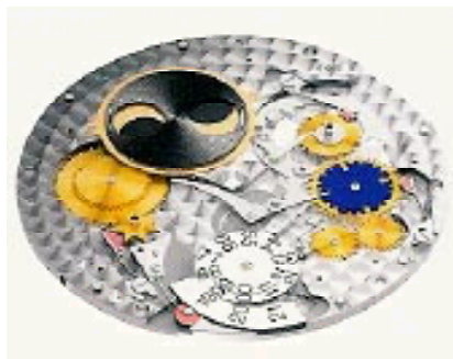
O realizare brillantă de la IWC: calendarul perpetuu.

G.K.: Inginerii și inventatorii de la IWC Schaffhausen sunt niște perfecționiști, care folosesc căi noi în arta ceasornicăriei și dezvoltă produse ieșite din comun pentru cunoscători. În domeniul specialităților ceasornicărești, ceasurile noastre seduc prin soluțiile tehnice rafinate, rezolvări ingenioase complexe și o excelentă ușurință de folosire. În domeniul ceasurilor pentru aviatori și de sport IWC are reputația de a fi un laborator tehnologic inovator și de a pasiona persoanele active cu instrumente functionale, robuste și cu un design sportivo-pragmatic.