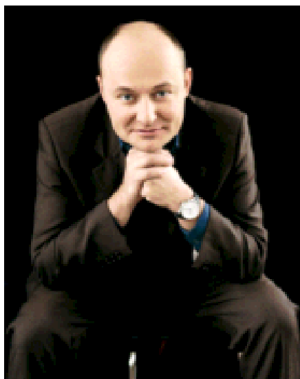
Georges Kern, directorul de la IWC.