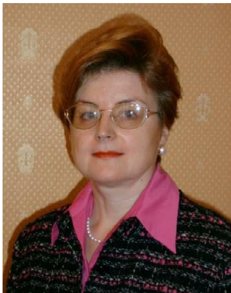
Doamna Tatiana Isticioaia.

“CHINA ESTE UN CAMPION AL PRODUCȚIEI DE MARFĂ, A DEVENIT CEL MAI MARE IMPORTOR ȘI POATE CEL MAI MARE CONSUMATOR.”