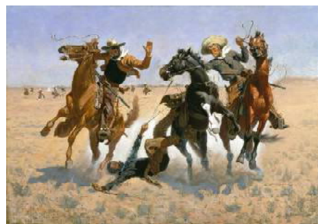
Frederic Remington: "Ajutând un camarad", 1889-90. Ulei pe pânză. © MFAH.

Sistemul eclectic după care este organizat acest muzeu, unde colecțiile provenite din donații sunt expuse împreună fără a se dispersa donația, face ca exponatele să nu urmeze firul cronologic. Oricum, ieșind din sala busturilor romane, am nimerit în secția Artă Americană până în 1945. Aici sunt prezentate, în mai multe săli, lucrări de pictură, sculptură și artă decorativă realizate de artiști plastici nord-americani în secolul XIX și în prima jumătate a secolului XX. De fapt, aceasta este o continuare a prezentării istoriei artei din Statele Unite, care începe în Colecția Bayou Bend din strada Westcott nr. 1, prezentare care se oprește acolo la mijlocul secolului XIX. O mare parte a colecției de artă nord-americană din secolul XIX este constituită din lucrări de pictură peisagistă, care reflectă în special sălbăciția naturii acelor meleaguri americane.